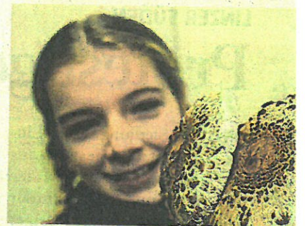
Die Pilzberatung ist im Oktober weiterhin geöffnet.